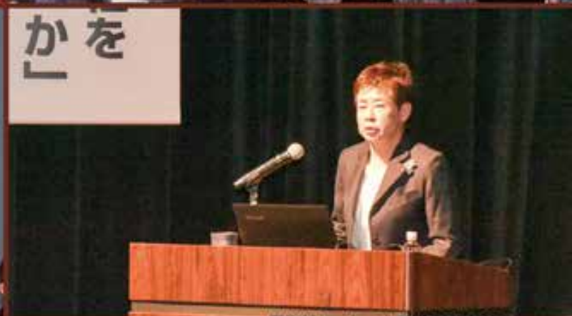
撮影協力:白山市松任写真同好会