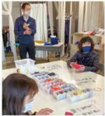
体験ラボにて小物作り中

最後に工場直販店「monobob (モノボブ)」にて、工場直販ならではの商品を実際に手に取ってみました。芝生の養生シートを利用したバッグやカーテンの裏地を表皮として使用したのものなど、取り扱う商品にもSDGsの意識が感じられました。