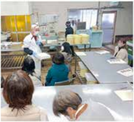
材料の説明をする講師

準備には実習生の協力も 教室に参加した方には、帰宅してすぐに漬け込みが出来る材料と漬け樽をセットにしたものが配布されま