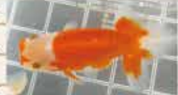
2位になったらんちゅう

最後に、最近の新しい趣味は、5年ほど前から石川県更紗蘭鈔(らんちゅう)協会に入会し、蘭鈔飼育(金魚)と品評会に出品しています。一昨年、2位になりました。