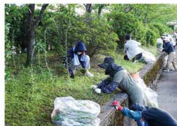
ソーシャルディスタンスをとっての作業

コロナ禍において関心が高まっているネット販売を会員事業者の皆様にも、簡単に挑戦いただくため、「白山市じわもんショッピングサイト」運営事業を実施します。当事業の主なメリットは次の3つです。