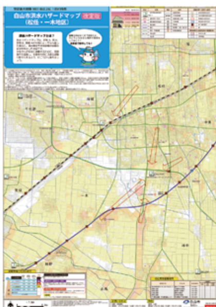
白山市：ハザードマップ

まず、自社にとって、どのような災害が想定され、どのような影響が出るかを知る必要があります。それには、ハザードマップの確認が有効です。ハザードマップとは、「自然災害による被害を予測し、その被害範囲を地図化したもの」です。白山市の洪水ハザードマップは、インターネットで「白山市 ハザードマップ」と検索すれば簡単に見つかります。HPでは地区別の詳細なデータが掲載されています。