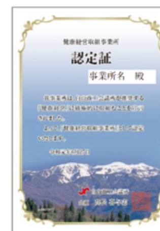
【認定証】 A4サイズ アクリル盾