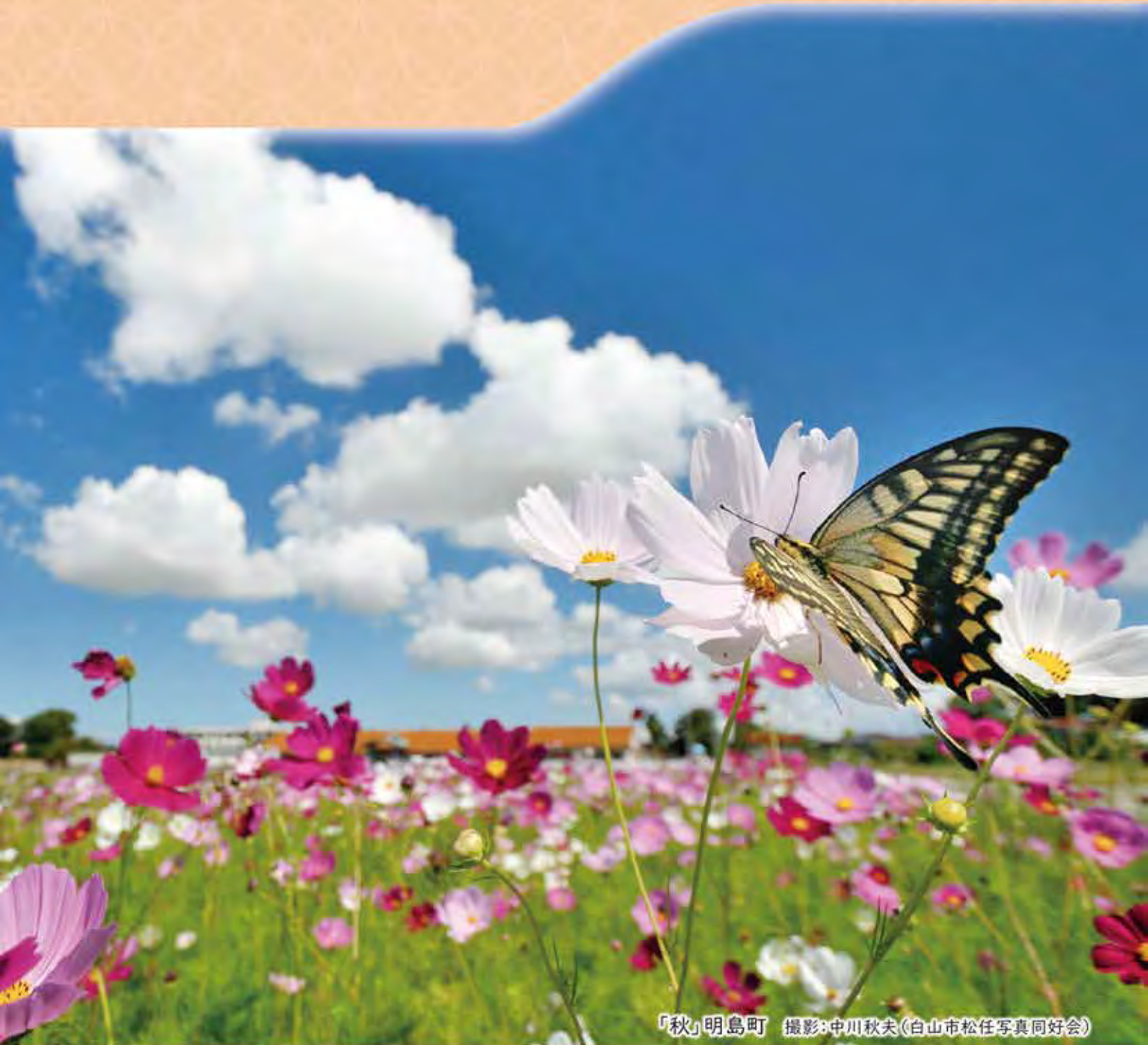
「秋」明島町