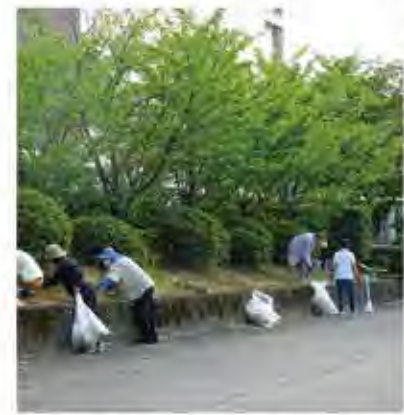
マスクをしての作業は大変でした

症の影響を受け女性会活動も縮小傾向の中、草刈りは屋外作業というこゝとで、三密に気を付けながらの開催になりました。三団体合わせて三十七名の参加がありました。早朝からの作業、薄曇りではありましたが、マスクを付けての作業は熱がこもり、汗が噴き出る様でした。一時間ほどで、ゴミ袋二十二袋分の下草刈り取りました。