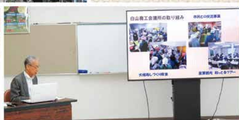
大型モニターでのプレゼンテーションの様子