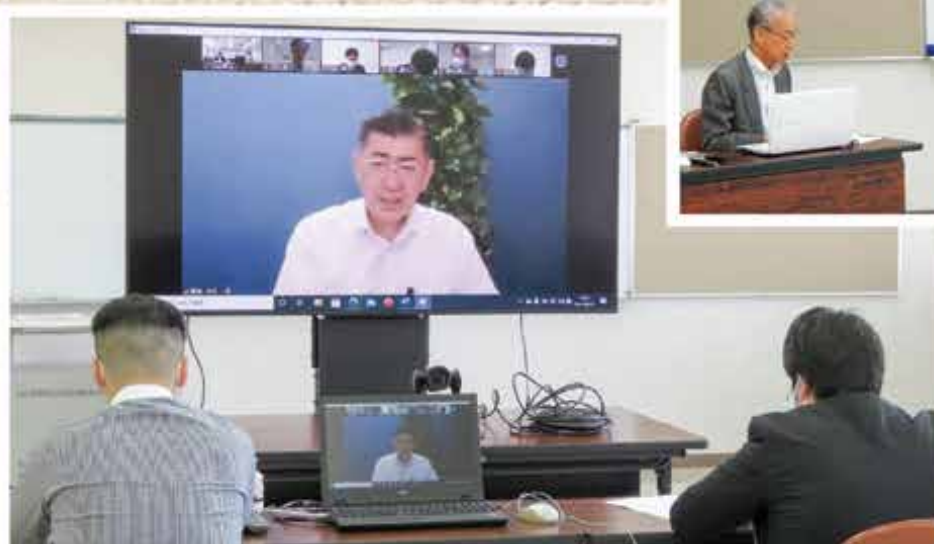
ウェブセミナー受講の様子