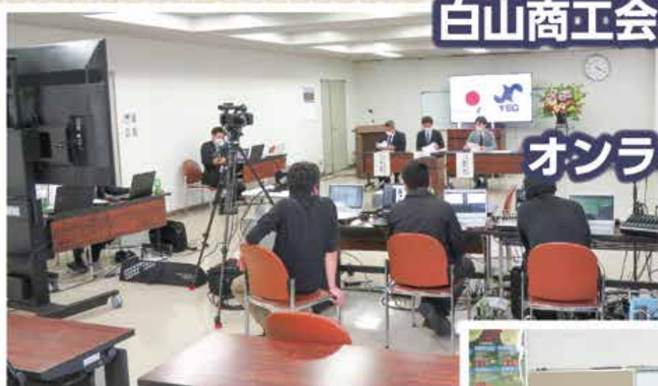
機材を持ち込んだ Zoom 配信の様子