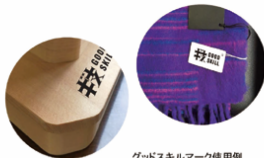
グッドスキルマーク使用例

URL http://www.waza.javada.or.jp/goodskill/