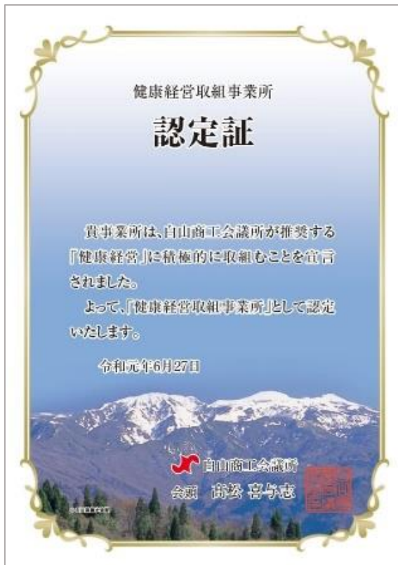
【認定証】 A4サイズアクリル盾

また、宣言後は健康経営エキスパートアドバイザーによるアドバイスや有効な情報提供など、健康経営のPDCAサイクルを回して「元気な会社づくり」を行うサポートを致します。