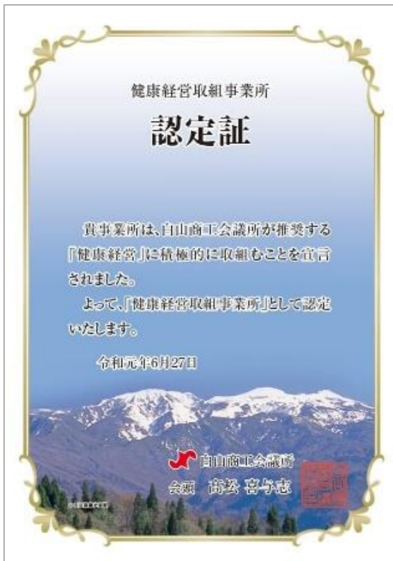
【認定証】 A4サイズアクリル盾

また、宣言後は健康経営エキスパートアドバイザーによるアドバイスや有効な情報提供など、健康経営のPDCAサイクルを回して「元気な会社づくり」を行うサポートを致します。