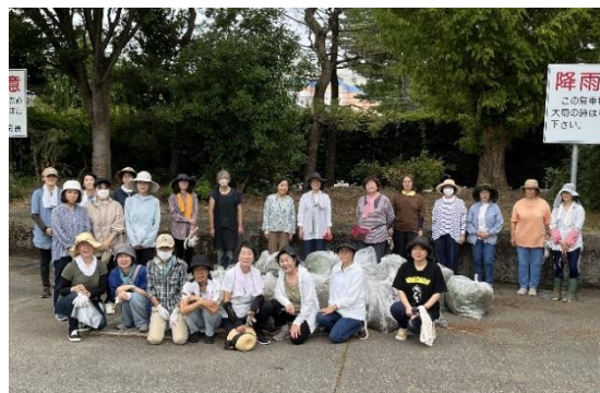
早朝から沢山の方にご協力いただきました。

台風の影響で1週間遅れての開催でしたが、白山ロータリークラブ夫人の会・美川商工会女性会の皆さんと、総勢約30名で約1時間半の作業で駐車場はとてもしっかりしました。わずかながらでも、患者さんや医療従事者のみなさんのお役に立てて良かったです。