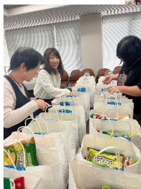
国際交流サロン用に支援セットを作りました。