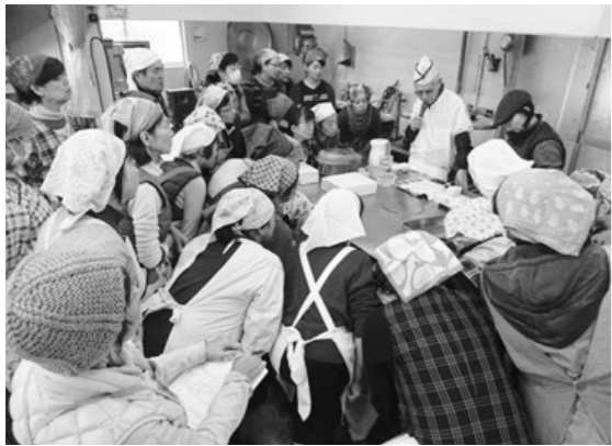
真剣に説明を受ける参加者

参加者は、講師の説明を聞きながら、実際に第一工程である大根の塩漬け作業までを行いました。