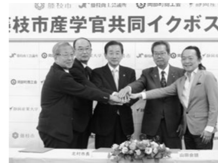
イクボス宣言する様子

【サービス業】 「今月は暖かい日が多く、天候が安定していたため、観光客を中心に来店が増えた。高値が続いていた農産物価格の下落により、採算も改善した」(飲食業)、「配送依頼は多いが、ドライバー不足から受注を絞らざるを得ない。燃料費の高騰が収益を圧迫しているため、さらなる運賃改定を検討している」(運送業)