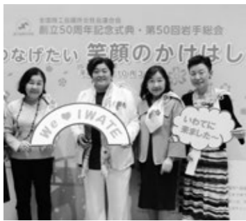
岩手総会の式典会場にて

続いて挨拶した三村日本商工会議所会頭は、「自らの地域を支える各地女性会の活動は経済成長を支える重要な基盤です。女性ならではの豊かな感性で地域経済に新たな活力を与えていただきたい。」と期待を寄せられました。