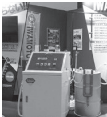
クーラントサーバー「楽〜ラント」

また、水道法上、水道配管と他の配管の接続は禁止されていますが本装置は「水道法性能基準適合品」として接続が可能です。