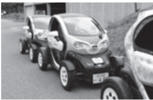
デザインも可愛い『温モビ』

引き続き行われた九月例会(OB会との交流会)では、青年部卒業生十八名と現役メンバーとの交流会が行われ、互いの親睦を深めました。 平成三十一年度会長予定者 引き続き行われた九月例会(OB会との交流会)では、青年部卒業生十八名と現役メンバーとの交流会が行われ、互いの親睦を深めました。