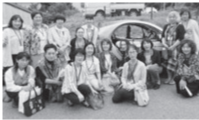
電気自動車を前に記念撮影