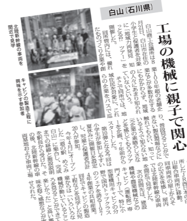
工場の機械に親子で関心

で行われた夏休みの小学生向けイベントの一つとして、知っとるっツアーが紹介されました。 「会議所ニュース」は、月三回発行され、中小企業や地域が直面しているテーマをタイムリーに捉え、商工会議所独自の視点でビジネスの現状を伝えています。