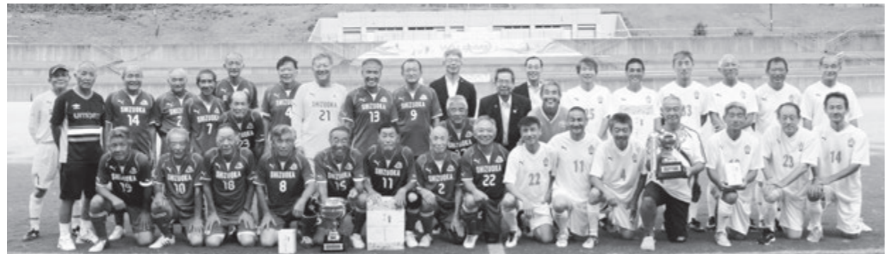
優勝チーム：静岡中西志太70(左側)・PET60(右側)