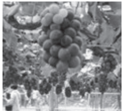
たわわに実ったぶどう

秋の味覚、 最初に、加賀フルーツランドでぶどう狩り。旬のブラックオリンピアを味わい、その後、石川県九谷焼美術館で伝統工芸九谷焼について学芸員によ