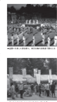
▲夏休み小学生向けツアー

で行われた夏休みの小学生向けイベントの一つとして、知っとるっツアーが紹介されました。 「会議所ニュース」は、月三回発行され、中小企業や地域が直面しているテーマをタイムリーに捉え、商工会議所独自の視点でビジネスの現状を伝えています。