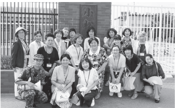
小松基地の正面門にて

講師を交えての昼食交流会があり、その後、航空自衛隊小松基地を視察研修しました。基地内をめぐり、小松基地の位置付け、日々の活動、任務について説明を受け、戦闘機の離発着の様子などを見学しました。