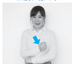
右手のこぶしで、左腕を2回叩く