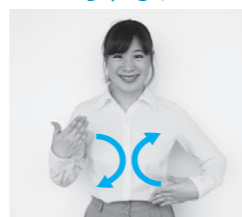
手のひらを胸の前で交互に上下させる

問合せ先: 白山市健康福祉部障害福祉課 ☎ (076) 274-9526 FAX (076) 275-2211