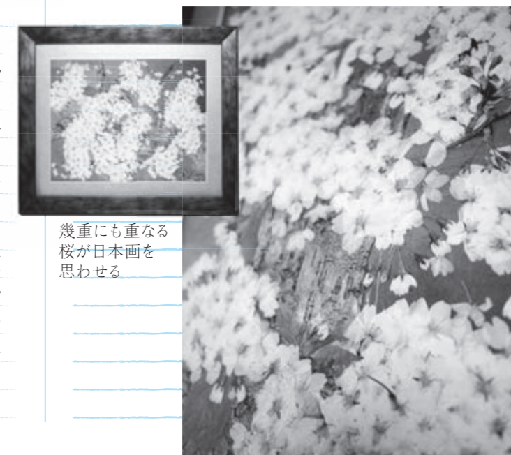
幾重にも重なる桜が日本画を思わせる

自宅の庭に咲く草花が花瓶や額に入り絵になると、とても嬉しくなります。最初は小さな額や小物作り、だんだんと大きな額に挑戦していくのですが、鳥や動物等を取り入れ、可愛い楽園をイメージして風景画を描いています。私はまだまだ未熟ですが、次はこんな作品を作りたい!と、夢は膨らむばかりです。