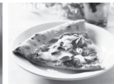
本格冷凍ピッツァ 「AsaPizza」 ラパピージェ