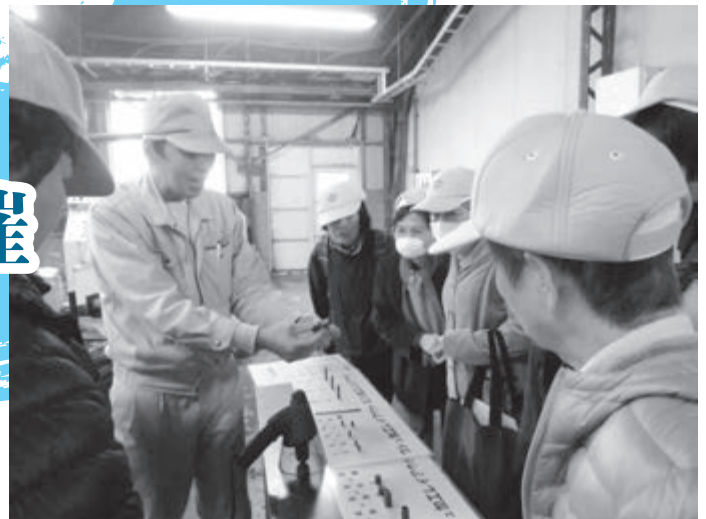
オリエンタルチエン工業(株)