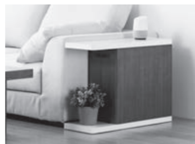
サイドテーブル「AIXS」 (株)松永家具