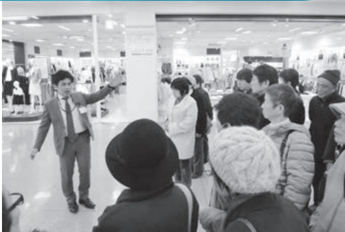
ユニー(株)アピタ松任店