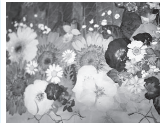
色鮮やかな押し花たち

庭先で簡単に出来る野菜をプランターで作るなどもしております。当初は一年草が多かったのですが、次第に多年草になり、種を撒いては育てるミニひまわり、ベビーリーフ、イチゴ等もプランターで作って楽しんでます。