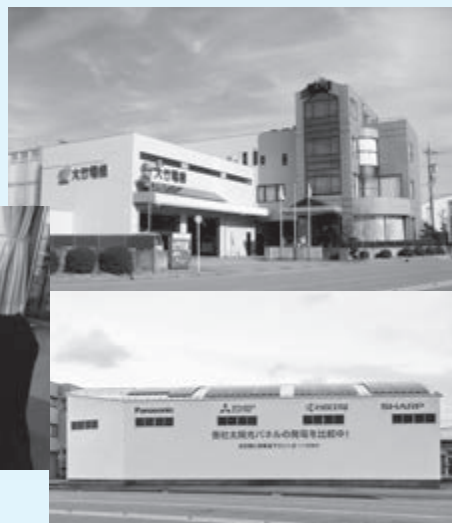
メーカーの実力を比較 結果は、店内で確認できます。