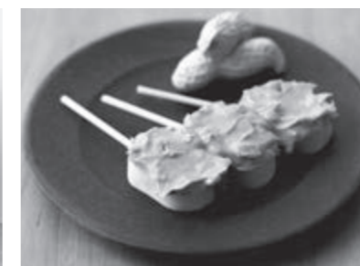
ピーナツバターだんご 「もちピー」 山喜本舗(有)