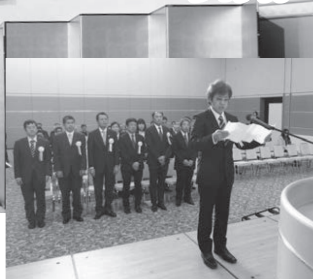
表彰を受け謝辞を述べる受賞者代表 (受賞者は2頁に掲載)