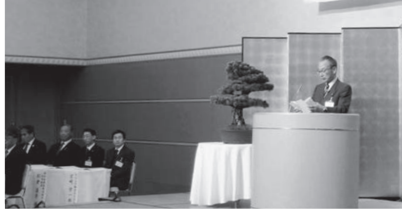
式辞を述べる高松会頭