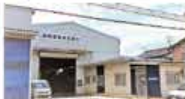
宮永事務所兼製造工場