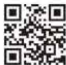
WEBサイトはコチラから

国内の用途限定米穀（米粉／飼料／加工／備蓄）の取り扱い、石川県内でトップクラス（当社調べ）の実績があります。お米の生産／集荷から販売まで、お気軽にご相談ください。