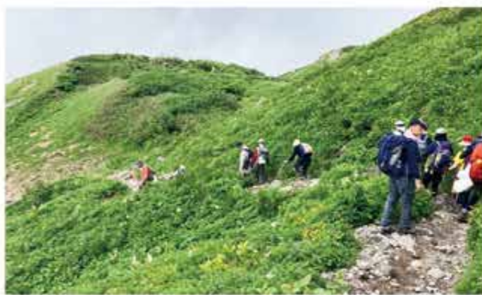
観光新道での下山

別当出合到着時はメンバー一同疲労困憊でしたがその分達成感に満たされ、記憶に残る登山となりました。今後も継続して開催していきたいと考えております。