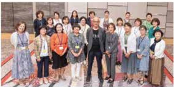
ホテル日航金沢にて

視察研修ではひがし茶屋街のそぞろ歩きを楽しみました。県外の修学旅行生も多く身近な観光地をあらためて観るのも新鮮な心持ちになりました。