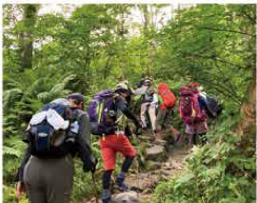
登りは砂防新道から

登りは砂防新道を通り天候にも恵まれ、比較的スムーズに室堂に到着し、その後親睦会を行いました。翌日は悪天候のため御米光を拝むことは出来ませんが、日の出後は天候が回復し山頂からの美しいお