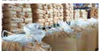
集荷された米（倉庫内）