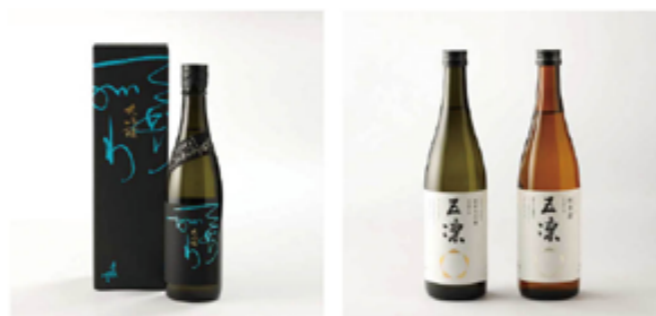
期間限定の「手取川 hand in hand」(左) 定番商品の「五瀬セット」(右) 季節によって商品を入れ替えるなどの工夫をしている

コロナ禍になって、じっとして元気がなくなっていくより、何か変わるかもしれないと思って、思い切って挑戦してみたら良い結果につながったことが一番嬉しいですね。何かしようと思ってなかなか足を踏み出せなかったんですけど、ECサイトにチャレンジすることがきっかけとなって、あれをしてみよう、これもやってみよう、いろいろ試せるのが良かったなと思います。