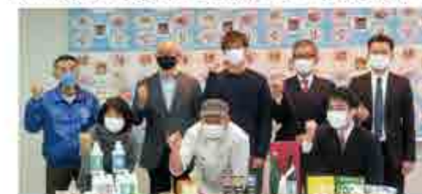
プレスリリースに集まった事業者の皆様