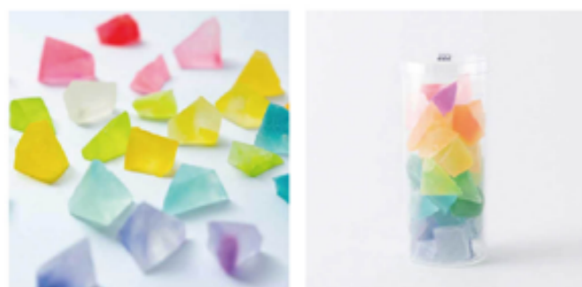
有彩霞堂 人気商品「琥珀糖」 きれいな色合いが人気を博している

3大モールに出店したことで、口コミとか、レビューをいただくのですが、良い意見ももちろん嬉しいんですけど、私たちが思っていることと異なる意見もあるので、それらを参考に商品を改善したり、自分たちの課題を発見できるのが嬉しいですね。