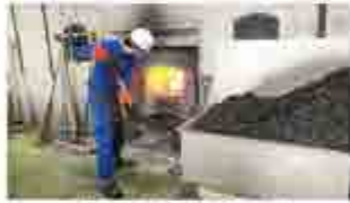
石炭を窯に入れる作業員

一日目は、サッポロビール博物館や時計台を見学しました。試飲会場では二種類のビールを飲み比べました。二日目は観光コースとゴルフコースに分かれました。前日は雨風が強かったのですが、当日は曇りながらも弱く、絶好のゴルフ日和でした。観光組は、ニッカウヰスキー余市蒸溜所や、小樽クルージング青の洞窟、小樽の街を散策いたしました。ウヰスキー工場では稼働日であったため、もろみを加熱し、アルコール分と香味成分を抽出する「石炭直火蒸溜」の作業を見ることができました。この蒸溜法は世界でも希少で、余市モルトの重厚でコクのある原酒をつくり出すそうです。