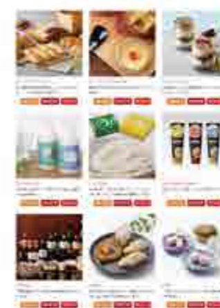
ECサイト トップページ

白山商工会議所では事業者の皆様へ、コロナ禍において注目されているネット販売を、初期費用を抑えながら気軽に挑戦していただきたいとの思いで、昨年12月よりECサイト「白山市じわもんショッピング」を立ち上げました。