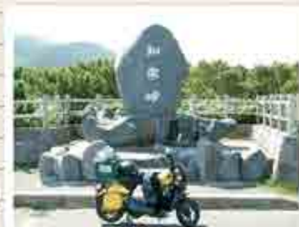
当時の愛車と知床峠

初夏の北海道の気候は過ごしやすく、景色も最高で、スクーターの最高速度が30キロしか出ない事を除いて快適そのものでした。その中でも、旅先で出会った普段関わる事のない人達との交流が楽しく、刺激的で、視界が広がるようでした。