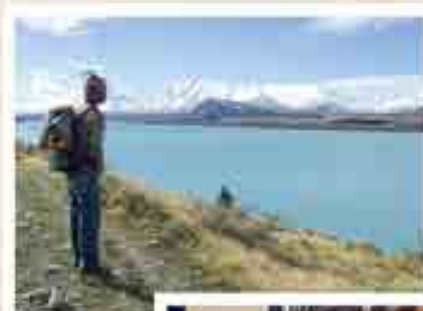
旅先の景色 「オホshima湖」