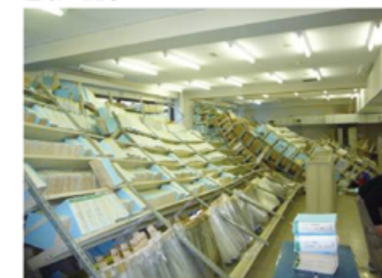
平成19年3月25日に石川県輪島市西南西沖40kmの日本海で発生したM6.9、最大震度6強を記録した能登半島地震。