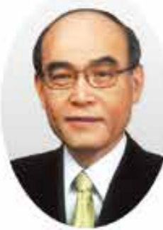
谷本 正憲 石川県知事