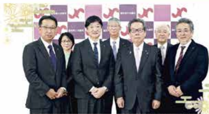
左から副会長、白山市長、江川副会長、事務局長、山田会長、執行委員長、藤枝副会長

白山商工会議所の皆様、新年明けましておめでとうございます。皆様におかれましては、新たな年を健やかに迎えのことと心からお慶び申し上げます。新型コロナウイルス感染症拡大による緊急事態宣言も昨年十月には解除されましたが、新たな変異株が世界各地で確認されており、第六波も心配されるところでもあります。これまで以上