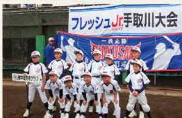
かわいいジュニアチーム

コーチになった当初は伝えたいことが伝わらないことに戸惑いました。当然ですが、1~6年生に同じ説明をしても伝わらないし、個々の性格や感性の違いも大きいのだと感じました。みんな素直なので言われたことを一生懸命にやろうとします。でも簡単には上手くいきません。健気に取り組む姿を見ていると何とか上達できるようにサポートしたいと思い、次第に伝え方は大丈夫か、どのように受け取っているかを気に掛けるようになりました。プロの指導者ではありませんし、プロの技術をもっているわけでもありません。でも何とか役に立ちたい。試行錯誤する中で、指導者間でも子供を惑わすことがないようにお互いの指導に聞き耳を立て、指導内容を確認しあうようになってきました。相手がどう感じているかが鍵であり、伝えつつもなってしまうことの危うさを感じたのです。これは会社でのコミュニケーションに通じるものです。成長を促す過程で、各々の特性、性格と指導方法、内容を見極めることが如何に大切か、それから“受け取り方”には大きな個人差があると実感しました。週末にグラウンドで汗を流すことが自身の体調管理とストレス発散に役立っているのですが、それ以外にも私にとって大きな気づきがあり、子供達にとっても感謝しています。