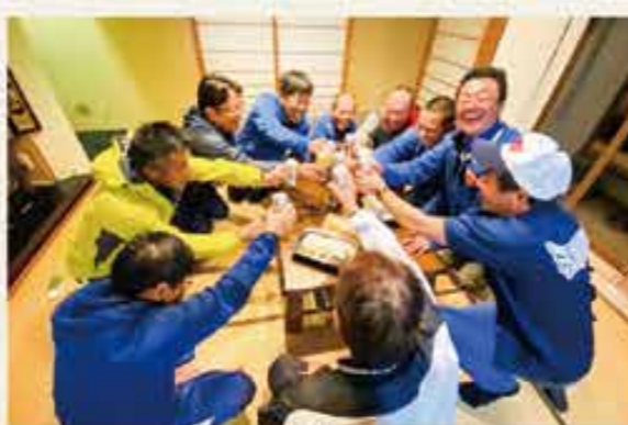
お父さんとの懇話も楽しみのひとつ

コーチになった当初は伝えたいことが伝わらないことに戸惑いました。当然ですが、1~6年生に同じ説明をしても伝わらないし、個々の性格や感性の違いも大きいのだと感じました。みんな素直なので言われたことを一生懸命にやろうとします。でも簡単には上手くいきません。健気に取り組む姿を見ていると何とか上達できるようにサポートしたいと思い、次第に伝え方は大丈夫か、どのように受け取っているかを気に掛けるようになりました。プロの指導者ではありませんし、プロの技術をもっているわけでもありません。でも何とか役に立ちたい。試行錯誤する中で、指導者間でも子供を惑わすことがないようにお互いの指導に聞き耳を立て、指導内容を確認しあうようになってきました。相手がどう感じているかが鍵であり、伝えつつもなってしまうことの危うさを感じたのです。これは会社でのコミュニケーションに通じるものです。成長を促す過程で、各々の特性、性格と指導方法、内容を見極めることが如何に大切か、それから“受け取り方”には大きな個人差があると実感しました。週末にグラウンドで汗を流すことが自身の体調管理とストレス発散に役立っているのですが、それ以外にも私にとって大きな気づきがあり、子供達にとっても感謝しています。