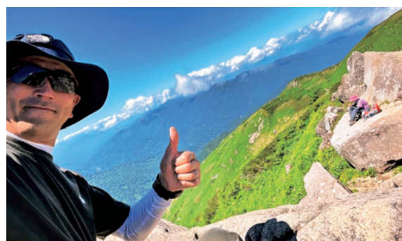
黒ボコ岩からの景色

のではと言われるのですが、標高があるのでさほどではありません。途中の中飯場、甚之助、黒ボコ岩で休憩をとって景色も楽しみながら、人を追い越しながら11時には室堂に到着します。私は54歳ですが、わりと早いほうのようです。室堂は今や生ビールも売ってますし、色々なものがあり、父の歩荷隊の時代とは変わりました。シャワーを浴びれる完全個室の白山雷鳥荘6室でもできました。地域交流委員会では白山雷鳥荘お泊り企画をしましたが、コロナ明けでみなさん気持ちがついていかないのか残念ながら中止になりました。来年こそは泊まりたいです！