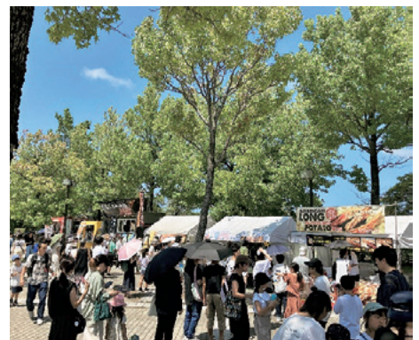
会場となった松任総合運動公園は多くの来場者で賑わいました。