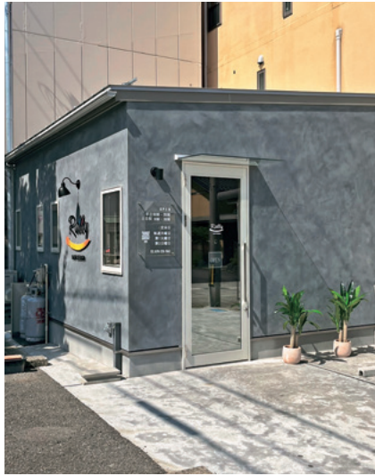
ラリーヘアデザイン外観

ジェントルは松任駅近くにあるメンズヘアサロンです。2023年2月には姉妹店ラリーヘアデザインを西新町にオープンいたしました。ジェントルは主に30代～50代の男性のお客様にご利用いただいております。男性に特化したメニュー展開、お店づくりに励んでおります。ラリーヘアデザインでは新たに女性のお客様にもご利用いただけるお店作りを目指してメニュー、お店づくりを行っております。これからもお客様に喜んでいただけるアイデアを考え、地域に貢献できるお店になっていけるよう努めてまいります。