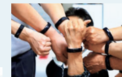
「健康ウォッチ」健康管理の意識向上に一役買っています