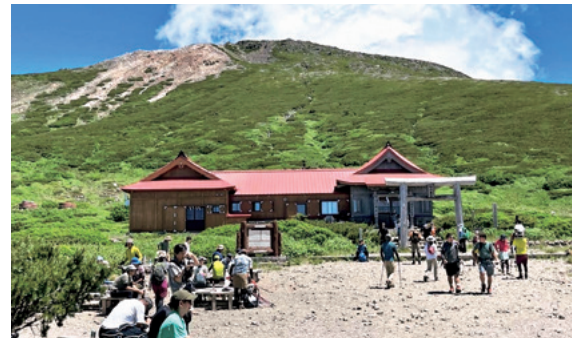
奥宮祈禱殿から頂上を望む

室堂で食事をとり、30分ほどで山頂へ登り奥宮でお参りをし、おみくじを引いて、標高2,702m御前峰で記念撮影をします。世俗を忘れさせてくれるパノラマビューがすごく気持ち良いです。