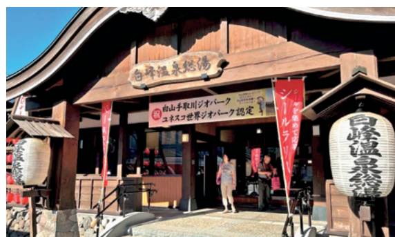
白峰温泉総湯で疲れをとる

帰ったら父と母の写真の前に飾るための石を2つひらいエコーラインで下山します。下山は足の負担が大きく、つま先には血豆ができて、若くないので2日後から筋肉痛に襲われます笑。15時には別当出合に到着して、帰り道に白峰温泉総湯に入るのもいつもの楽しみです。露天風呂から白峰スキー場跡の今でも競技用には使われているヤングバレーの景色にもいつも癒されています。