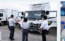
冷蔵庫に飲み物を常備。今年の夏は、本当に大活躍でした(^_^)