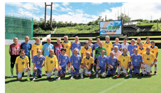
黄色ユニフォーム: スーパル インフィニト (東京都) 紫色ユニフォーム: 藤枝FC70 (静岡県)