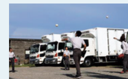
キャッチボールをした後は、自然と会話が弾みます

今後もより強い連携を作っていくために、一人ひとりの健康に対する意識を向上できる環境を提供したいと考えております。