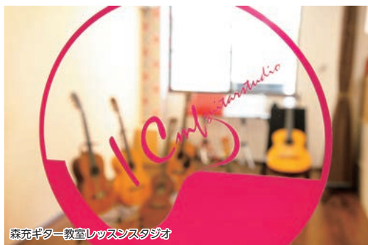
森充ギター教室レッスンスタジオ