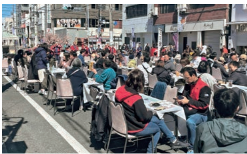
たくさんの参加者で賑わうイベントの様子