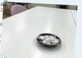
休憩室に塩飴を配備