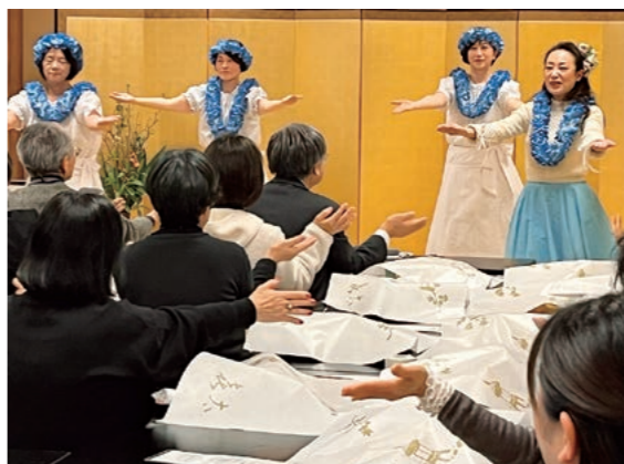
手ぶりを真似てフラと一緒に踊りました。

年明けの能登半島地震からひと月が過ぎ、お互いの無事を確かめ合う一席となりました。また、被災地支援の話題から、思わぬご縁が繋がる一幕もあり、商工会議所女性会としてより交流を深めることが出来たように思います。