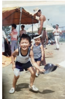
懐かしの社会体育大会

小学生の時は、母親に習い事を受けさせていただきました。そのことは今では大変役立っています。また