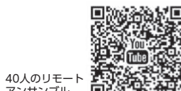
40人のリモート アンサンブル