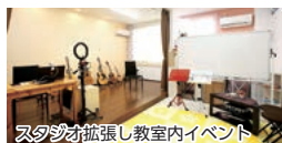
スタジオ拡張し教室内イベント