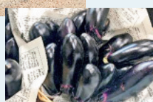
農家さんから旬なお野菜(^^)♪

血圧計やトレーニング機器を設置。アテネ不眠尺度を活用して、快眠度の自己チェックも実施しました。