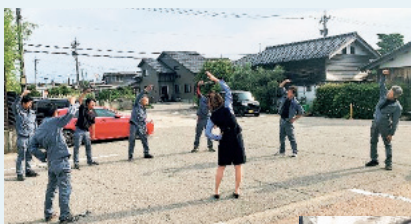
全社員でラジオ体操を実施。

【今後の計画】今後は上記取り組みや課題を数値的に表し「見える化」を進め、各人が健康状態を意識し易いようにしていきます。これと同時に、健康状態と業務における生産性の関連についても考察し、各々の成果を把握出来るような仕組みを整備する計画をしています。