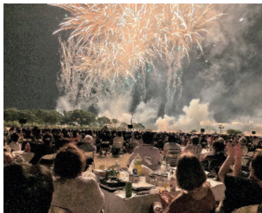
迫力ある花火と音楽に感動

花火大会は大変な人出で帰路も混雑しましたが、参加された方々のご協力もあり無事に交流会を終了することが出来ました。