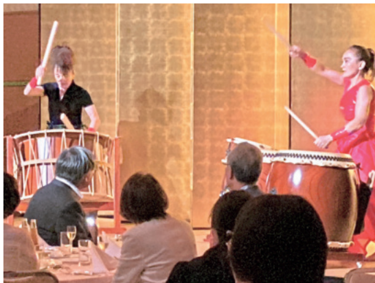
交流会を彩る太鼓の響き

午後からの視察研修では、単会女性会ごとに分かれて、白山市内の企業を視察していただきました。