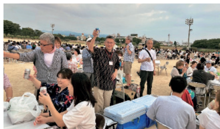
坂上部会長による乾杯で交流会開始