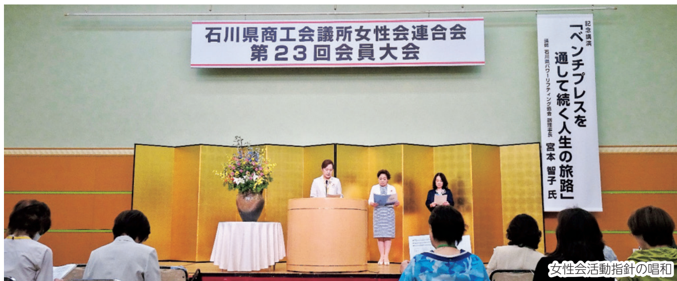
女性会活動指針の唱和