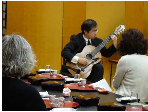
ギターが奏でるメロディに引き込まれます。

「アルハンブラの思い出」や情 熱的なスペインの曲、そして映 画「マチネの終わりに」より「幸 福の硬貨」、映画「禁じられた遊 び」より「愛のロマンス」などが