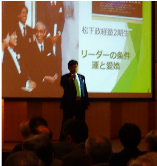
リーダーの条件とは何か・・・