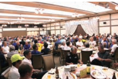
レセプションの様子