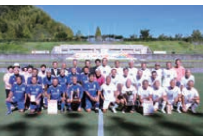
優勝チーム 清水クラブ60(左側)・茅ヶ崎シニア70(右側)