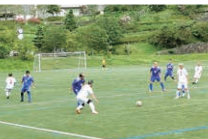
白山市 O-60 選抜チーム

チームも参加し、熱戦が繰り広げられました。試合は、O-60の部では清水クラブ60、O-70の部では茅ヶ崎シニア70がそれぞれ初優勝を果たしました。本大会の企画運営を円滑に推進するため、大会実行委員会を組織し、藤枝らしさを強調した大会にするための準備を進めました。大会運営には地元藤枝FC・藤枝東FC・焼津飛魚S.C・静岡中西志太70・静岡中西部75の五チームのほか、当所青年部・女性会・本大会より藤枝市役所サッカー部にも協力いただきました。五日(木)に行われた歓迎レセプションには、関係者や大会参加24チームを含め、258名が出席し、交流を深めました。