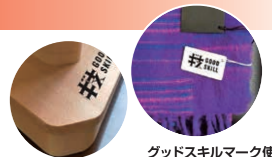
グッドスキルマーク使用例

グッドスキルマークの表示を希望する技能士や事業主の方は、「グッドスキルマーク申請書」等に必要事項をご記入のうえ、申請書類一式を石川県職業能力開発協会技能振興コーナーへ郵送にてご提出ください。