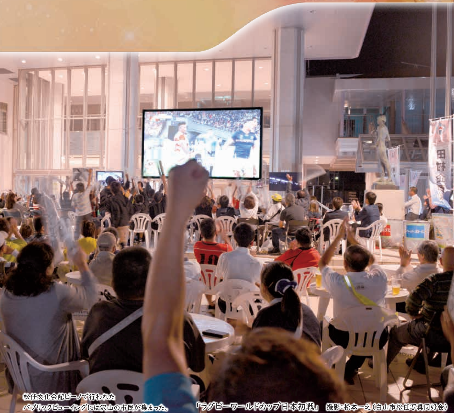
松任文化会館ピーンで行われたパブリックビューイングには沢山の市民が集まった。