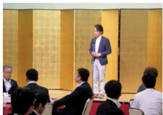
交流会で挨拶をする徳田会長

例会では、サマーフェスティバル HAKUSAN二〇一九説明会とOB会との交流会が行われました。サマーフェスティバルの説明会では、各部会長が現在の進捗状況などを説明し、会員同士で当日の流れを確認しました。会場をグランドホテル白山に移して行われたOB会との交流会では、青年部卒業生二十一名と現役メンバーとの交流会が行われ、互いの親睦を深めました。