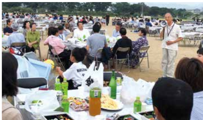
挨拶をする宮江部会長

宮江部会長による挨拶の後、小柳副会長による乾杯の発声があり、交流会が始まりました。食事・歓談し、会員相互の交流を深めました。