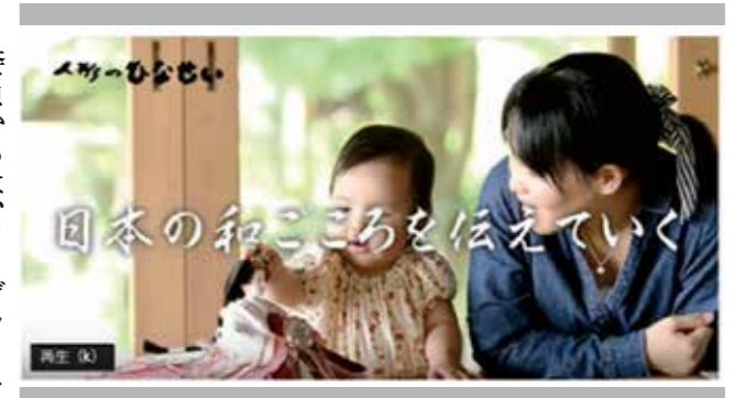
作成支援した動画の一例（雛人形店）

委員からは、ターゲットを更に絞り込んだ動画の制作を行ってほしい、動画や商品開発にまだ至らない事業者への段階的な支援を行ってほしいといった意見・要望が出ました。 本年度の事業については動画制作支援プロジェクトを行う他、経営計画や事業計画策定支援の為のセミナーも開催を予定しています。