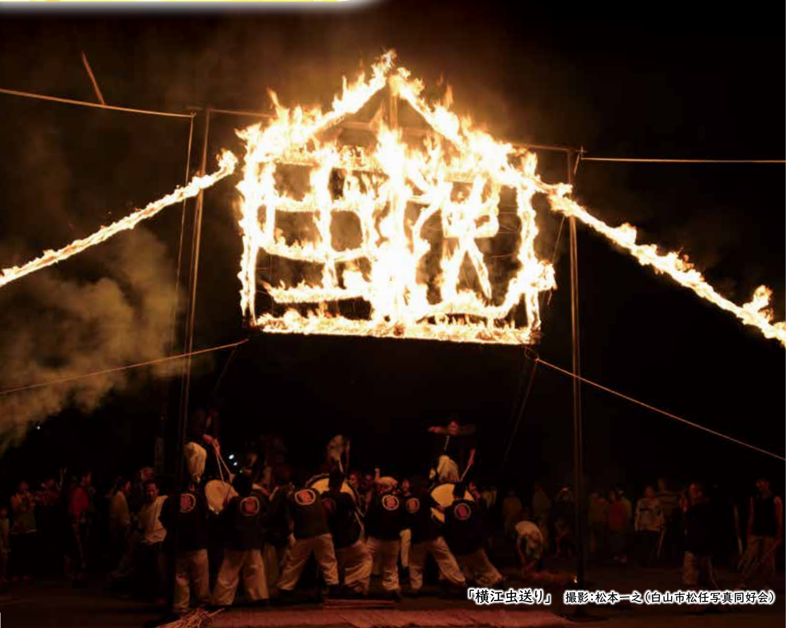
「横江虫送り」