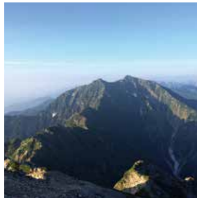
五龍岳頂上から鹿島槍ヶ岳

約一時間の登りで五龍岳(標高二八四二m)です。富山県側は快晴で、黒部峡谷を挟んで剣・立山はもちろん、遠く薬師岳も望むことがで