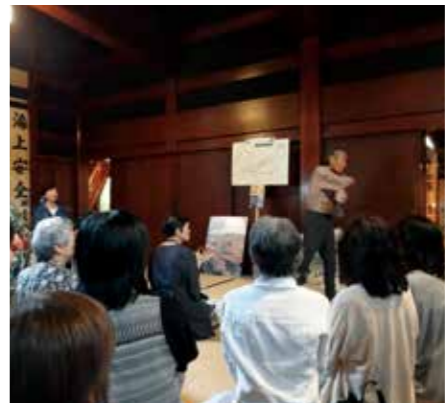
身振り手振りで説明をするガイドさん