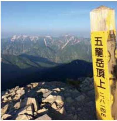
五龍岳頂上から剣岳

このコースは、平成十三年に全く同じルートで縦走したことがあり、平成二十一年には今回と逆コースで歩いたことがあります。学生時代を含めてこのコースは確か五回目になります。好天に恵まれた記憶がありません。今回も突然発生した台風六号の影響もあってか、二日目の十時過ぎまでは富山県側の視界が開け、剣・立山連峰を望むことができましたが、それ以外はほぼ終日濃いガスに包まれ、時折雨が降る、風も強い残念な天候でした。改めて相性が悪い、と感じたところです。