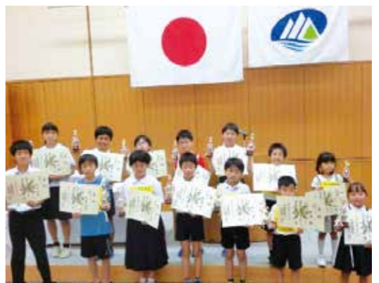
入賞された皆さん