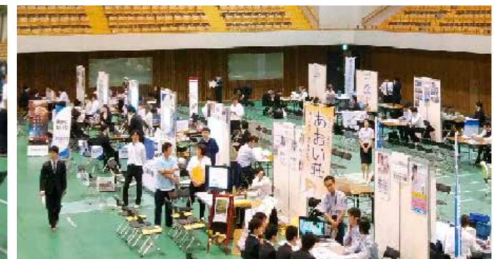
志太3市合同企業ガイダンス2020の様子