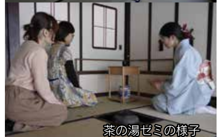
茶の湯ゼミの様子