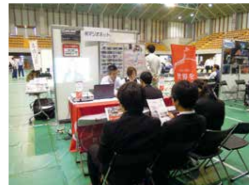
担当者の説明を聴く学生