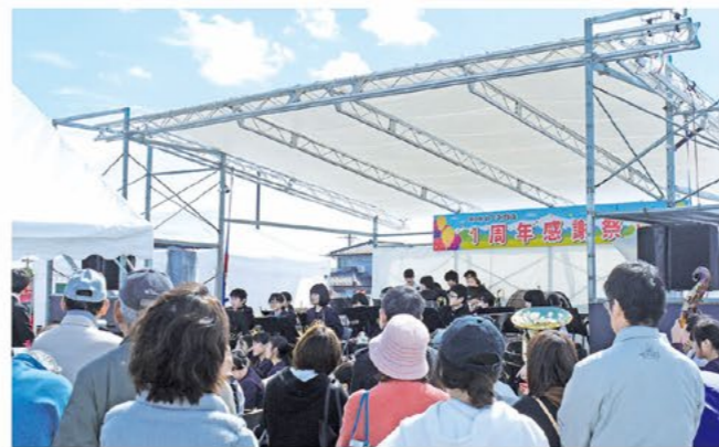
ステージイベントの様子

道の駅めぐみ白山では、昨年四月二十七日のオープンから一年、年間約四十七万人の利用(内訳は県内が八割、県外が二割)がありました。今年の大連休中に開催された一周年感謝祭はかわいい園児の踊りで開幕し、特設ステージでは様々なパフォーマンスが披露されました。また期間中は鉄道模型運転会、グルメ市、餅つき大会、ミニ白バイの乗車撮影会などのイベントも行われ来場者を楽しませました。