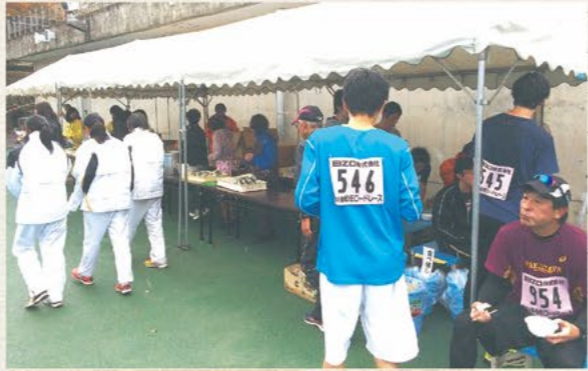
コシヒカリのおにぎりとおめつ汁が振舞われました

マラソンの楽しさは自分のペースで走れる事です。そしてゴールした時の達成感は最高です。またレース後、大会本部が準備してくれたフードはお腹に沁みる旨さです。因みに松任ロードレースではコシヒカリのおにぎりとおめつ汁が振舞われます。