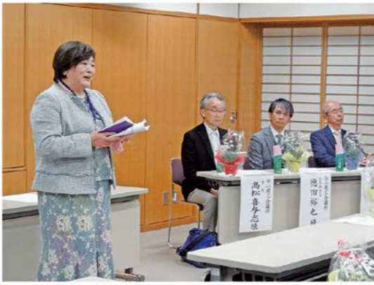
挨拶をする池元会長

する社会が期待されていると感じます。女性会もますます発展していきたい。」と挨拶がありました。その後の議案審議において、「平成三十一年度事業報告ならびに収支決算」、「平成三十一年度事業計画(案)ならびに収支予算(案)」、「役員補充」の三議案について承認されました。