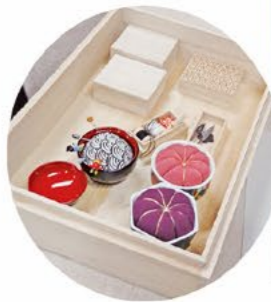
伝統工芸が生かされた針山とお針箱