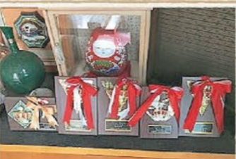
社会体育大会で買った盾です