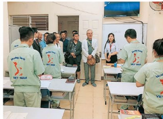
ハノイの教育センターにて

表彰制度や教育カリキュラムも充実しており、日本語の勉強や日本文化、生活ルールを一通りトレーニングしているようで、技能実習生と質疑応答を行いました。