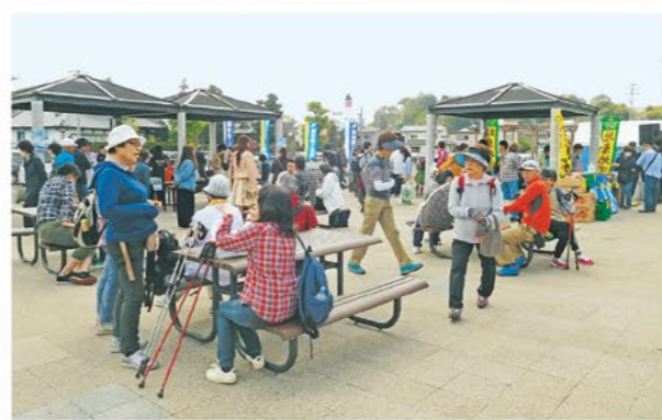
賑わいを見せるイベント広場