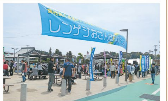
レンゲジおさんぽマルシェの様子