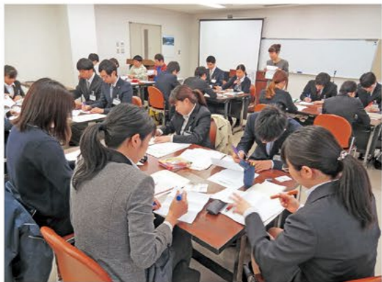
自己紹介を考え中