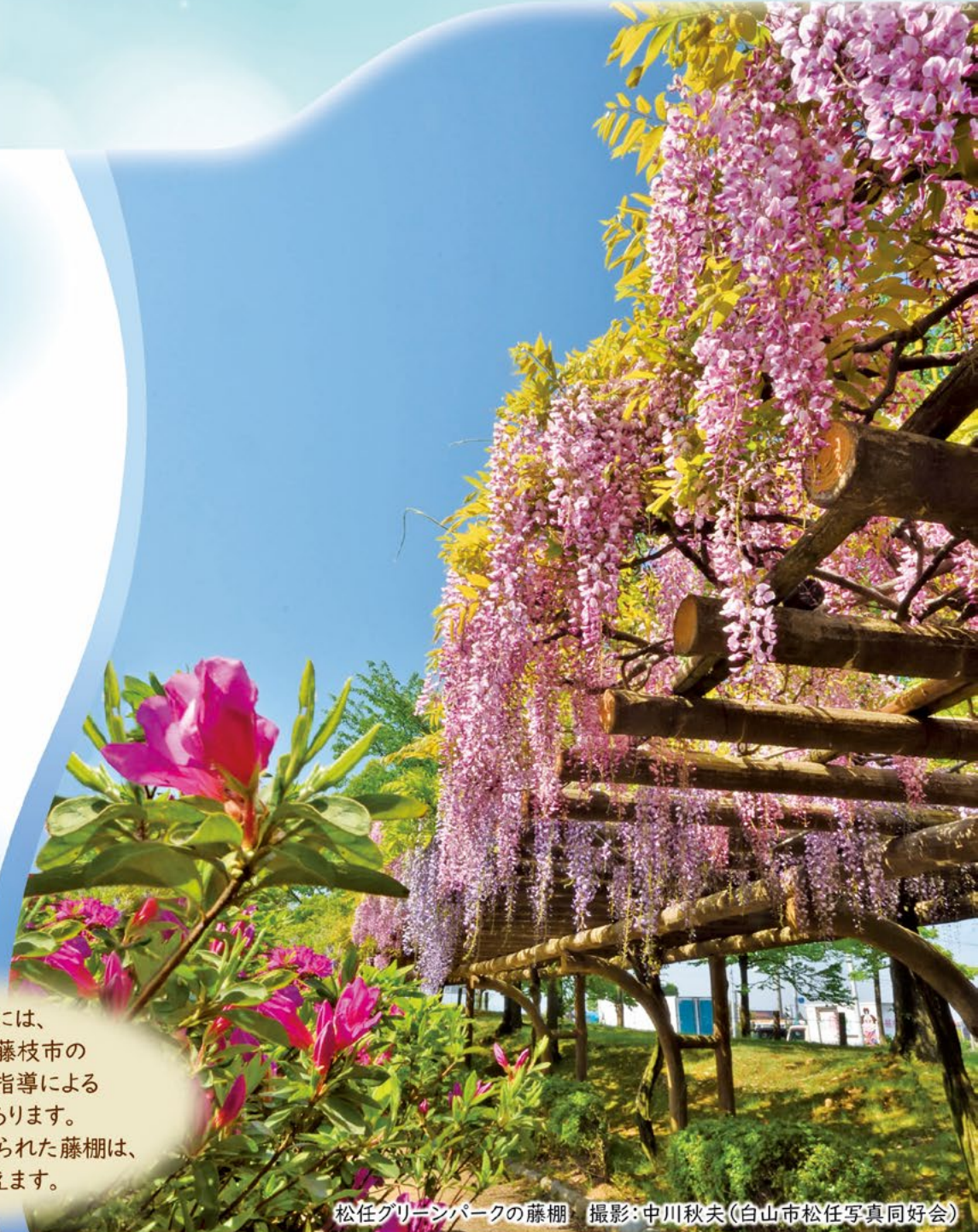
松任グリーンパークの藤棚

松任グリーンパークには、 姉妹都市である静岡県藤枝市の 「藤を育てる会」の協力・指導による 藤棚(全長310m)があります。 公園の広場を囲むように植えられた藤棚は、 毎年5月に見頃を迎えます。