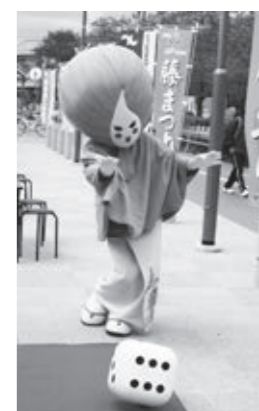
サイコロを振るゆるキャラ

あずまの活用や、地元商店街な どに足を運んでもらうことを目的に、 初めて企画したものです。