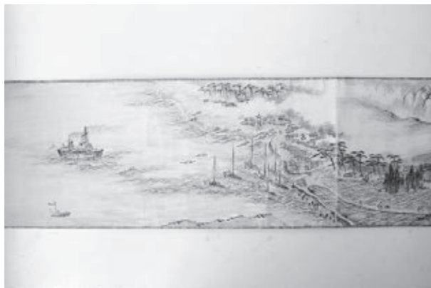
市指定有形文化財「紙本淡彩 金石眺望」(部分)