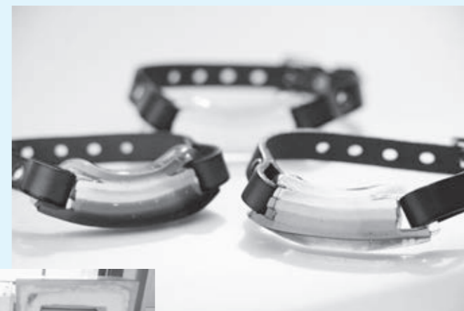
ガラスと革を組合せたアクセサリー